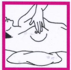
Ñe kwoj babu